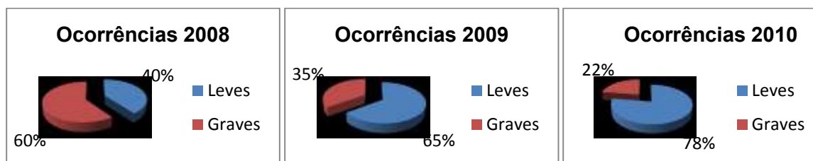
Gráfico 4- B1b- Ocorrências indisciplinadas por nível de gravidadeem2008.

Os atos de indisciplina serão classificados por índice de gravidade considerando desacato ao professor e uso de violência física como grave e as conversas ou brincadeiras em sala de aula, como ocorrências leves por sua natureza lúdica.